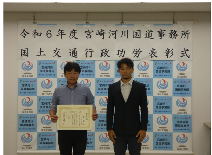
表彰状(優良技術者表彰)